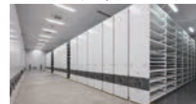
浦和美園本社のアーカイブセンター (東武デリバリー)