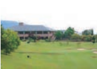
下仁田カントリークラブ