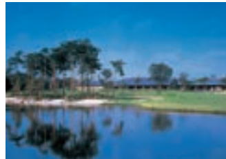
東武藤が丘カントリー倶楽部