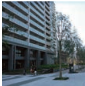
外構植栽工事（東武緑地）

そのほか、東武ビルマネジメントでは、大型ビル、マンション等の設備管理、清掃、防犯・防災警備の運営管理をトータルに担い、東武開発では、砂利・砕石等良質の骨材・生コンクリートの安定供給に努めています。さらに、東京スカイツリー®地区で地域エネルギーを供給する東武エネルギーマネジメントでは、佐野線葛生駅南側土地をはじめとして8か所で太陽光発電事業を行っており、西池袋地区及び錦糸町北口地区においても西池袋熱供給・錦糸町熱供給がそれぞれ熱エネルギーの安定供給を図るなど、グループ各社は連携しながら安心して住み続けられる街づくりに貢献しています。