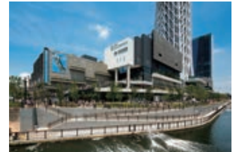
東京ソラマチ（東武タウンソラマチ）