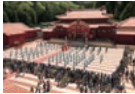
東武ワールドスクウェア（首里城）

東武ワールドスクウェアは、「世界の遺跡と建築文化を守ろう」をテーマに、1993年4月に開園しました。世界文化遺産に登録されている47物件を含め、合計102点の有名建築物を25分の1スケールで精巧に再現しています。園内は、現代日本、アメリカ、エジプト、ヨーロッパ、アジア、日本の6つのゾーンからなり、細部にまでこだわった建築物のほか、個性ある14万体的人形や、季節ごとに異なった景色を楽しめる庭園も見所となっています。