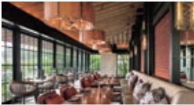
ザ・リッツ・カールトン日光

ホテル業では、国内外における観光やビジネス等の需要に応えるべく、宿泊や料理などの高品質なサービスを通して、お客様から選ばれるホテルを追求しています。2020年には、「ザ・リッツ・カールトン日光」のほか、国内初上陸ブランドや好立地を活かした宿泊主体型ホテルを新たに東武グループに加え、より幅広いお客様にご利用いただける体制を整えました。今後も、消費者ニーズを捉えたホテルでの体験価値向上に努めていくほか、周辺における観光資源を活かすなど、地域と連携しながら収益増大及びエリアの活性化に貢献していきます。