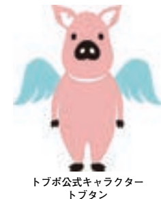
トブポ公式キャラクター トブタン