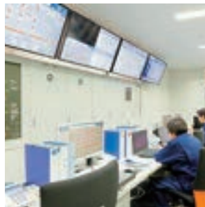
東京スカイツリータウン®を一元管理する 防災センター（東武ビルマネジメント）