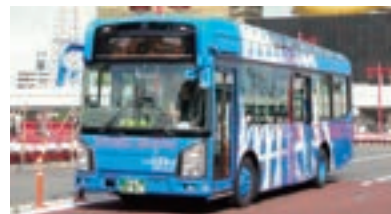
スカイツリーシャトル®上野・浅草線 (東武バスセントラル)