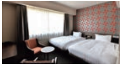
和光市東武ホテル