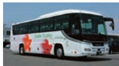
高速乗合バス「アザレア号」(関越交通)

貨物運送業は、在庫管理など東武運輸グループによる一体化運営で、貨物の輸送・配送はもとより、保管・物流加工・工場内請負をトータルに手がけ、荷主様のあらゆる要望にお応え提案できるワンランク上の物流サービスを展開しています。事業所は、関東を中心に静岡、名古屋、大阪をカバーし、荷主様の信頼の上に成り立つ物流集団を形成しています。また、東武デリバリーは、文書・媒体など情報資産の保管管理・電子化・溶解処理や事務所移転、個人向けにクローゼットルーム運営と宅配型保管サービス、鉄道機器やフィットネスマシンなど精密重量物の輸送管理から設置に至るまでクオリティが求められる物流を担っています。