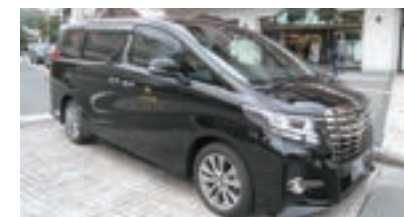
アルファードタクシー (日光交通)