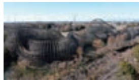
東武動物公園 水上木製コースターレジャーI(ドワーエ)

東武動物公園では今後も、動物園と遊園地が融合したハイブリッド・レジャーランドとして、新たな魅力づくりを推進してまいります。