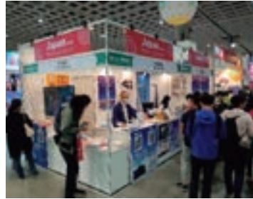
台北事務所 旅行博出展

アジア営業支社（台北事務所、上海連絡事務所）を開設し現地旅行会社・メディアへの情報発信及び現地観光関連団体等との連携を軸とした関係強化を図っているほか、海外の主要都市において情報発信の窓口となるレップ（代理店）を設置しています。現地情報を的確に収集・分析するとともにグループ事業エリアへの誘客に向け、沿線地域やグループ施設に関する観光情報を発信しています。