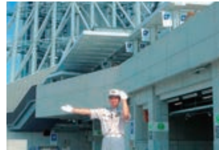
東京スカイツリータウン駐車場管理業務（東武不動産）

東武タウンソラマチでは、東京スカイツリータウン®の施設管理並びに東京ソラマチ®の商業運営を行い、継続的な収益力強化を図っています。