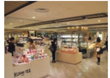
東武百貨店池袋店 地下2階「eatobu」

東武ストアは、2018年10月に当社の完全子会社となりました。同社は、「地域で一番買いやすい店づくり」を目指し、品質・鮮度、価格、品揃え、清潔さ、サービスの充実による店舗価値向上を図ることで、常に、お客様に喜んでいた