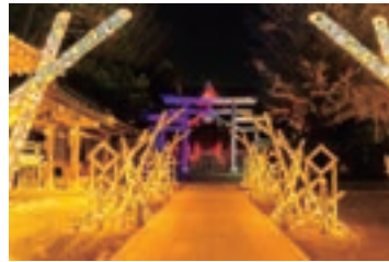
隅田公園ライトアップ事業

週末のお出かけに悩む沿線のファミリー層と、地域の魅力発信などに課題を抱える沿線の地方自治体・観光事業者の両者をつなぐべく、田植えや稲刈り、自然を体験するツアーなど「学び」をテーマにしたプログラムの構築を進めています。